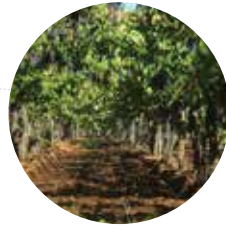
FUNDO LA ORIENTAL 90 has.