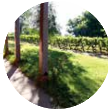
FUNDO LAS CASAS 50 has.