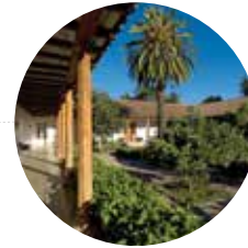
FUNDO SAN VICENTE 90 has.